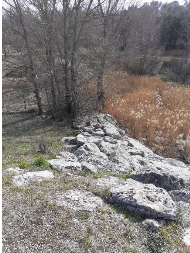
Photo 7 : arbres au droit du bajoyer rive gauche chenal évacuateur de crues